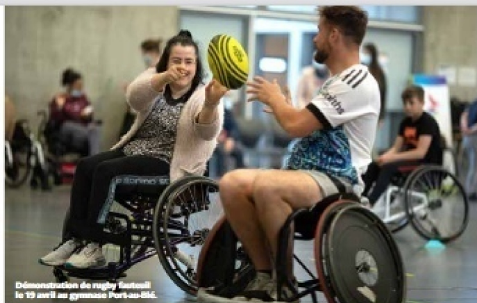
Démonstration de rugby fauteuil le 19 avril au gymnase Port-au-Dieu.